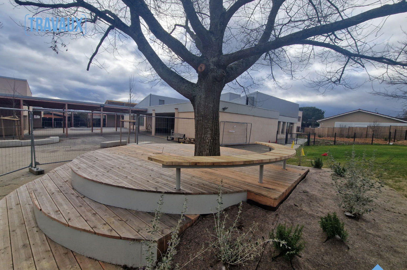
Une nouvelle structure bois aux Ambrits.